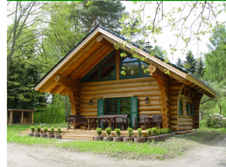
Lage der Jagdhütte